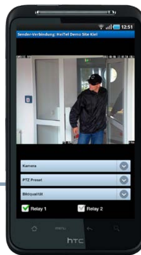
Livebildübertragung mit Kamera- und Relais-Steuerung