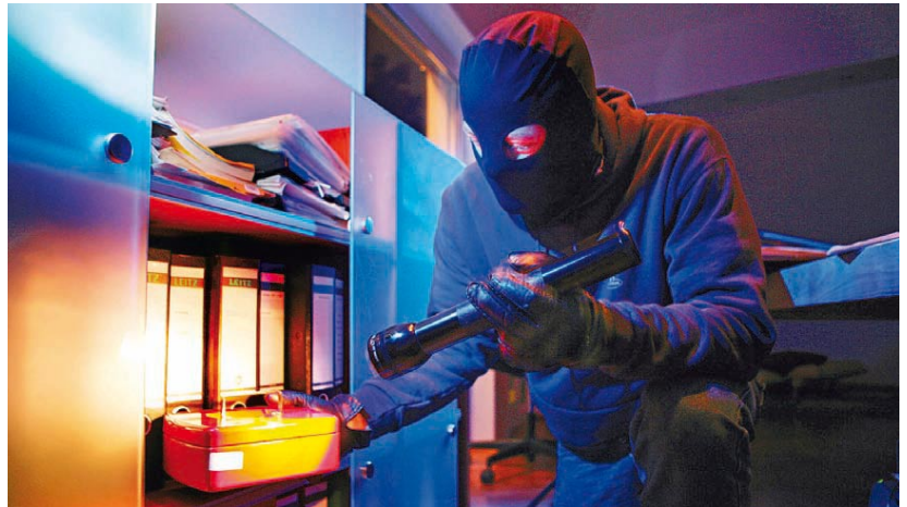
Leichtes Spiel für Einbrecher und kein Versicherungsschutz für den Eigentümer: Wenn das Bargeld nur in einer losen Geldkassette verstaut und diese nicht mit dem Boden verbunden ist.

Wird eine Bäckerei überfallen, dann lösen die Mitarbeiter/innen einen Überfalltaster aus und gleichzeitig beginnt die installierte Videoanlage mit ihrer