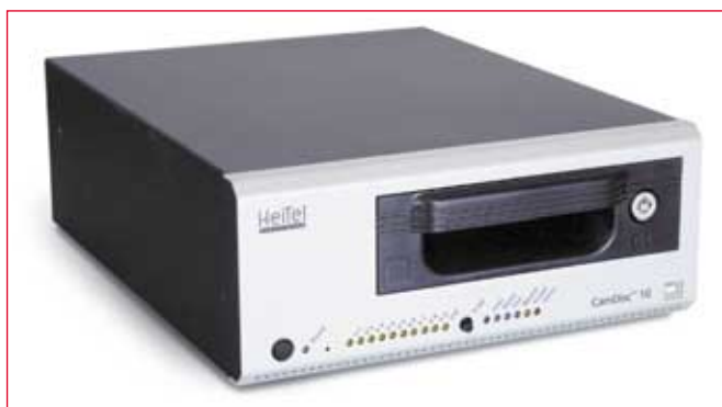
CamDisc SVT : 4- lub 10-kanalowy rejestrator wizji z rozbudowanymi możliwościami komunikacyjnymi

Linc Sp. z o.o. ul. Czechosłowacka 177B, 60-115 Poznań tel. (+48 61) 839 19 00 fax. (+48 61) 839 22 78 e-mail: info@linc.pl www.linc.pl