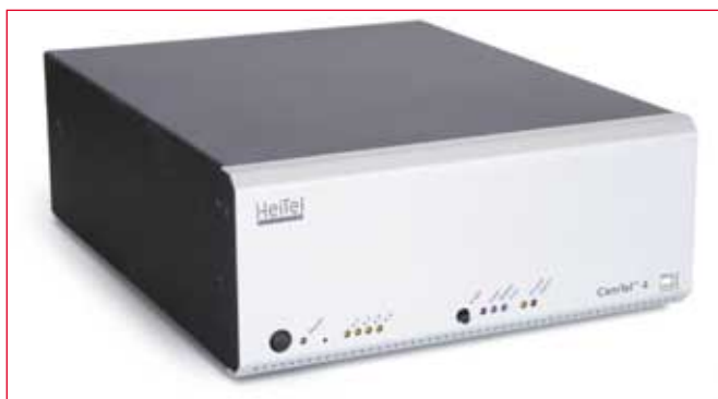
CamTel SVT : 4- lub 10-kanalowy nadajnik wizji z rozbudowanymi możliwościami komunikacyjnymi i krótkookresową rejestracją lokalną

Szczególnie interesującą cechą nowych urządzeń jest technologia MultiLink. Umożliwia ona równoczesną transmisję fonii i wizji przez różne media, np. połączenia TCP/IP i ISDN mogą mieć miejsce jednocześnie. Zgodnie z filozofią firmy HEITEL, wszystkie nowe produkty mogą zostać przyłączone do linii transmisyjnych zarówno o dużej, jak