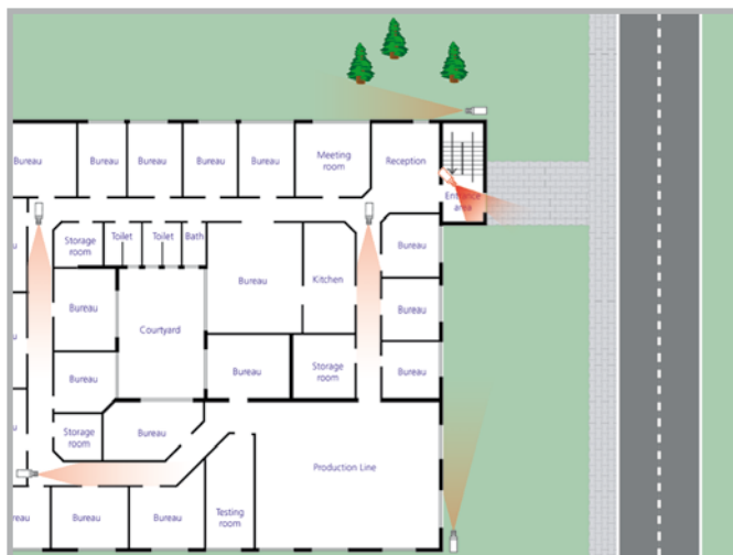
4. Nivel: Plano de distribución detallada del edificio